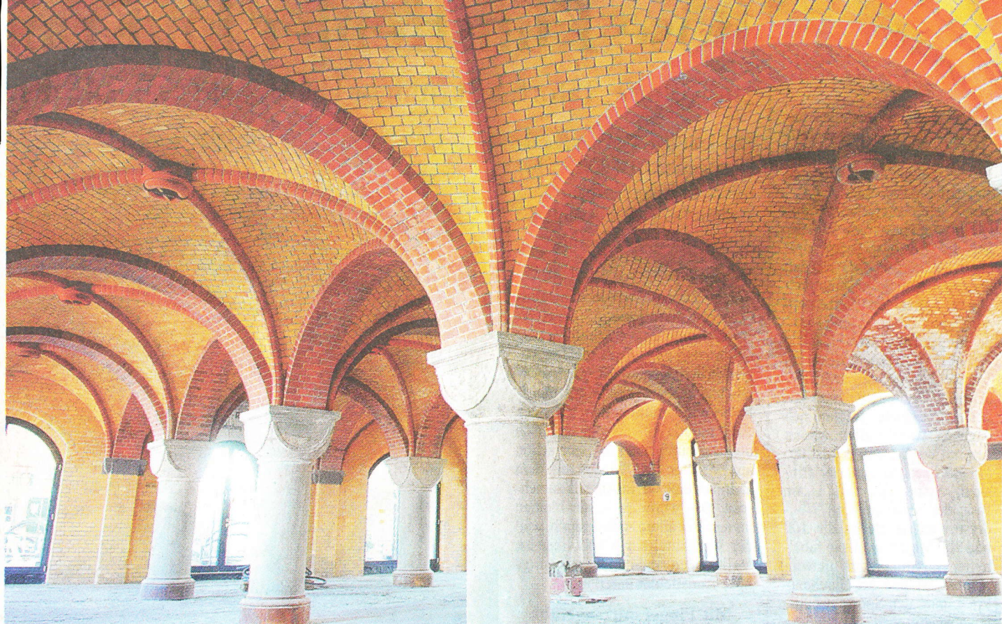
Einst Lagerhalle, jetzt ein Ort mit viel Atmosphäre: die Gewölbehalle im Hafenspeicher „Halle 11“ im Rheinauhafen